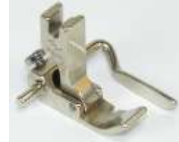
Kantenfuß Sohle links 10,3mm breit mit Lineal Lineal rechts 1,6-25mm verstellbar