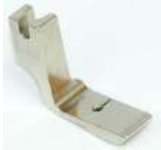
Kräuselfuß mit Standard Stufe