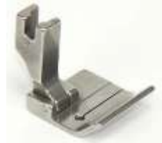
Nähfuß für Säumer groÙ