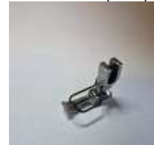
Kantenfuß NT Sohle links breit 8mm mit Fingerschutz

Art.-Nr.46663 Herst.-Nr.P36-NF-G (1690) (S8000N)