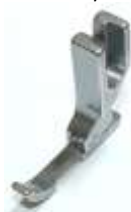
Kantenfuß NT Sohle links schmal 5,4mm Erstausrüsterqualität

Art.-Nr.17483 Herst.-Nr.P36N-NF/YS (1684)