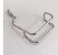
Fingerschutz Typical GC20606, GC20665, GC6-7

Art.-Nr.46233 Herst.-Nr.88WF3-004 3,2-6,4MM