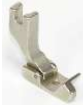
Gelenkfuß für Säumer 1/4"