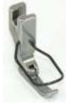
Kantenfuß Sohle links 4,9mm breit mit Fingerschutz

Art.-Nr. 1035 Herst.-Nr.1391 (12435HN) P36N-G