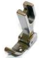
Gelenkfuß für Säumer 3/16"