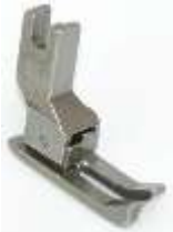
AGF NT links federnd 0,8mm (1/32") Ausgleichsgelenkfuß, Nadeltransport

Art.-Nr.42814 Herst.-Nr.13406/1 (22L-NF)