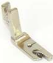
Säumerfuß starr 3,2mm (1/8")