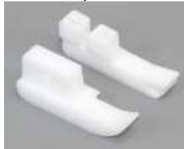
Ersatzsohle AGF Teflon re. fed. 1/32"