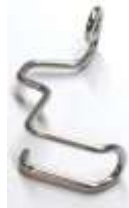
Fingerschutz Typical GC 6730

Art.-Nr.46233 Herst.-Nr.88WF3-004 3,2-6,4MM