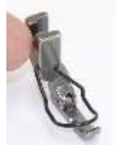
Kantenfuß Sohle rechts 4,9mm breit mit Fingerschutz

Art.-Nr. 1030 Herst.-Nr.1381 (31358HN) P36LN-G