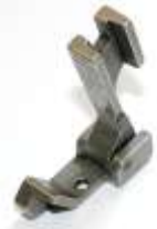
Gelenkfuß für Säumer 1/16"