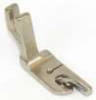
Säumerfuß starr 4,8mm (3/16")