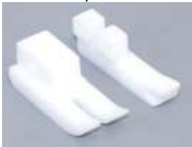
Ersatzsohle AGF Teflon re. fed. 3/16"