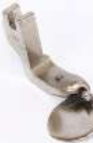
Rollsaumfuß starr mit Kugel 0,8mm (1/32")