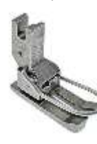
AGF NT links federnd 3,2mm (1/8") mit Fingerschutz Ausgleichsgelenkfuß, Nadeltransport