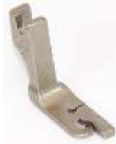
Säumerfuß starr 1,6mm (1/16")