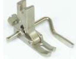
Geradstichfuß mit Lineal 1,6-25mm rechts