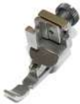
Kantenfuß Sohle links/rechts verstellbar 7mm breit