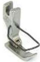
Kantenfuß Sohle links 8,0mm breit mit Fingerschutz

Art.-Nr. 1037 Herst.-Nr.1396 (P36-G) (12435HW-G)