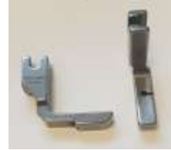
Kräuselfuß mit kleiner Stufe, schmal FuÙbreite 8mm

Art.-Nr.25459 Herst.-Nr.1480 (120828N, P50N)