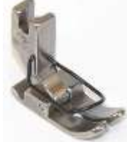
Geradstichfuß 15,0mm breit mit Fingerschutz