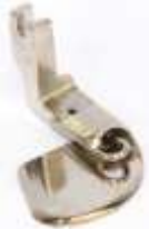
Rollsaumfuß starr 4,8mm (3/16")