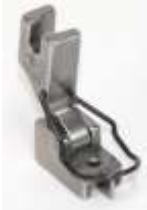
RV-Fuß verdeckt mit Nase und Fingerschutz

Reißverschlussfuß zum Nähen nahtverdeckter Reißverschlüsse.