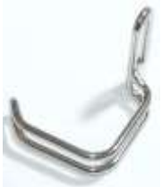
Fingerschutz Tony 301/305