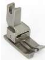
AGF NT links federnd 3,2mm (1/8") Ausgleichsgelenkfuß, Nadeltransport