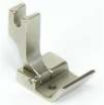
Nähfuß für Säumer mittel