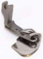
Säumerfuß gefedert f. Quernähte 4,8mm