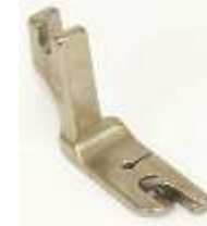
Säumerfuß starr 4,0mm (5/32")