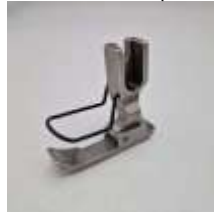
Kantenfuß NT Sohle rechts breit 8mm mit Fingerschutz

Art.-Nr.46662 Herst.-Nr.P36L-NF-G (1689) (S0080)