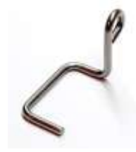
Fingerschutz Mitsubishi Original