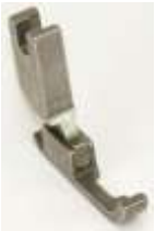
Kantenfuß NT Sohle links schmal 5,4mm

Art.-Nr.17483 Herst.-Nr.P36N-NF/YS (1684)