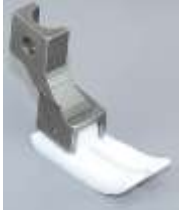
Teflonfuß für Dürkopp 212