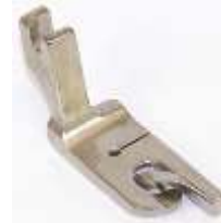
Säumerfuß starr 6,4mm (1/4")