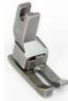
AGF NT links federnd 1,6mm (1/16") Ausgleichsgelenkfuß, Nadeltransport

Art.-Nr.42208 Herst.-Nr.13407/1 (211-NF)