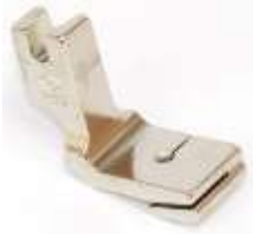
Kräuselfuß mit Bandzuführung