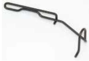
Fingerschutz Rimoldi 327