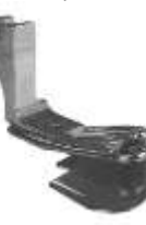
Säumerfuß gefedert f. Quernähte 3,2mm