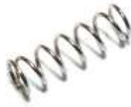
Feder für AGF 2,6mm x 8mm