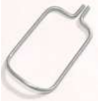
Fingerschutz Pfaff zum Einkleben/-löten Original