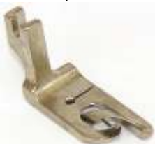
Säumerfuß starr 8,0mm (5/16")