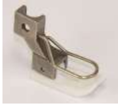
Teflonfuß für Dürkopp 212 Fingerschutz