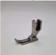
Geradstichfuß NT 8,2mm, Sohle rechts schmal Nadeleinstich bis rechte Kante ca. 2,4mm

Art.-Nr.17470 Herst.-Nr.P36-NF/YS (1690)