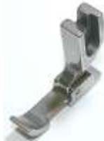
Kantenfuß NT Sohle links breit 7mm

Art.-Nr.17470 Herst.-Nr.P36-NF/YS (1690)