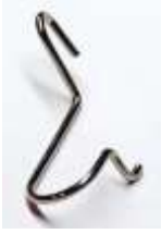
Fingerschutz Juki G 8 für Schnellnäher