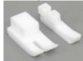
Ersatzsohle AGF Teflon re. fed. 1/4"