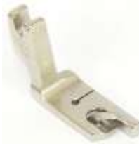
Säumerfuß starr 5,6mm (7/32")