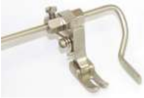
Geradstichfuß mit Lineal 5,0-45mm beidseitig Mit 2 Linealen für rechts und links.