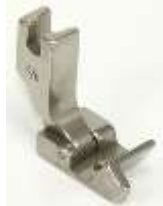
Gelenkfuß für Säumer 3/8"