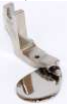
Rollsaumfuß starr mit Kugel 1,6mm (1/16")