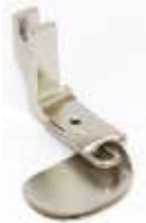
Rollsaumfuß starr 1,6mm (1/16")