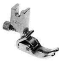
Kräuselfuß verstellbar mit Schraube