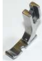
Kantenfuß Sohle links 7,7mm breit (CN) einfache Qualität "Made in China"

Art.-Nr.17464 Herst.-Nr.P36/YS (1395) (12435HW)