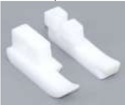
Ersatzsohle AGF Teflon re. fed. 1/16"