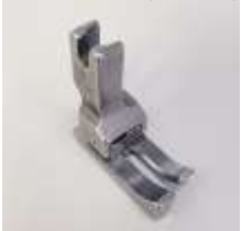
AGF NT links federnd 1,6mm (1/16") Ausgleichsgelenkfuß

Art.-Nr.42208 Herst.-Nr.13407/1 (211-NF)