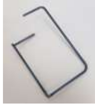
Fingerschutz Juki LU 2210