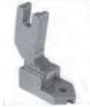
RV-Fuß verdeckt mit Nase, 3eck Spitze

Reißverschlussfuß zum Nähen nahtverdeckter Reißverschlüsse.