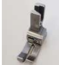
AGF NT links federnd 0,8mm (1/32") Ausgleichsgelenkfuß mit Gesamtbreite 14mm

Art.-Nr.42814 Herst.-Nr.13406/1 (22L-NF)