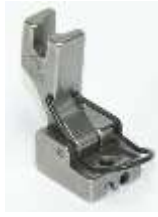
RV-Fuß verdeckt Fingerschutz

Reißverschlussfuß zum Nähen nahtverdeckter Reißverschlüsse.