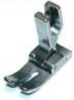
Geradstichfuß 15,0mm breit