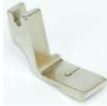
Kräuselfuß mit hoher Stufe

Art.-Nr.25459 Herst.-Nr.1480 (120828N, P50N)