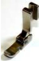
Kantenfuß Sohle links 7,9mm breit Erstausrüsterqualität

Art.-Nr.17464 Herst.-Nr.P36/YS (1395) (12435HW)