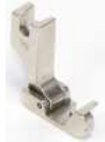
Gelenkfuß für Säumer 1/8"