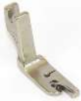
Säumerfuß starr 2,4mm (3/32")