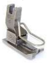
AGF NT links federnd 2,4mm (3/32") mit Fingerschutz Ausgleichsgelenkfuß, Nadeltransport