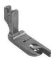
Säumerfuß starr 2,0mm (5/64")