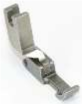
Kantenfuß NT Sohle rechts breit 7mm

Art.-Nr.46662 Herst.-Nr.P36L-NF-G (1689) (S0080)