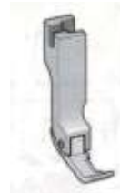
Kantenfuß NT Sohle links schmal 5,4mm Suisei "Made in Japan" Topqualität