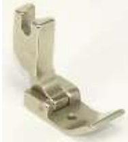
Nähfuß für Säumer mittel