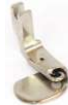
Rollsaumfuß starr 3,2mm (1/8")