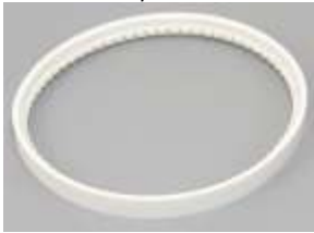
Doppel-Rollbandfuß Ersatzband aus Teflon