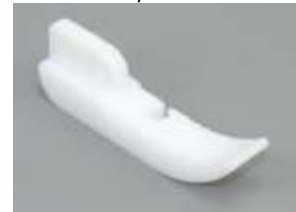
Ersatzsohle Kantenfuß Teflon