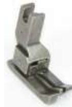
AGF NT links federnd 2,4mm (3/32") Ausgleichsgelenkfuß, Nadeltransport