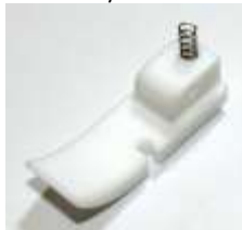
Ersatzsohle Kantenfuß Sohle li. breit Teflon