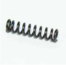
Feder für AGF 2,0mm x 8mm