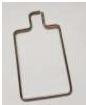
Fingerschutz Typical TW3-441