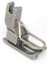
AGF NT links federnd 1,6mm (1/16") mit Fingerschutz Ausgleichsgelenkfuß, Nadeltransport